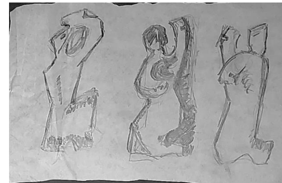
Werkkatalog Graphik Nr. 3254

Darüber hinaus gibt es zwei graphische Skizzenblätter, durch die sich die Entwurfsarbeit noch besser nachvollziehen lässt: