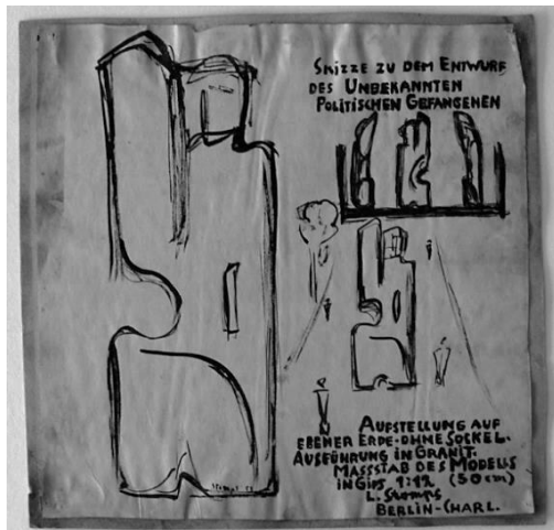
Werkkatalog Graphik Nr. 3082

Zwei Entwurfsskizzen zum Denkmalentwurf befinden sich im Sammlungsbestand der Berlinischen Galerie: