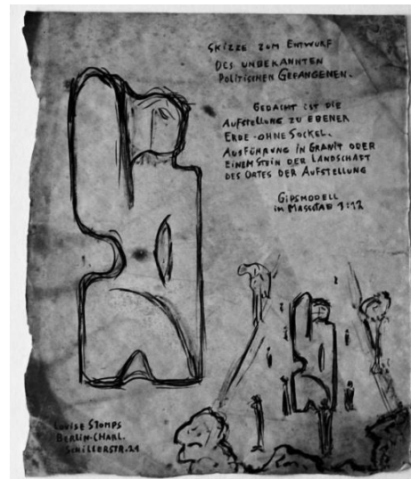
Werkkatalog Graphik Nr. 3083