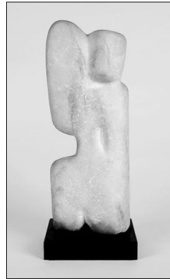
WKNr. 1047 (Marmor)

Über den Verbleib der Marmorskulptur war Näheres lange nicht bekannt, bis sie zufällig während der Ausstellung "Der unbekannt politische Gefangene" im Kunsthau Dahlem auf einer Auktion für 16.500 € ersteigert wurde und als Leihgabe noch in dieser Ausstellung gezeigt werden konnte.